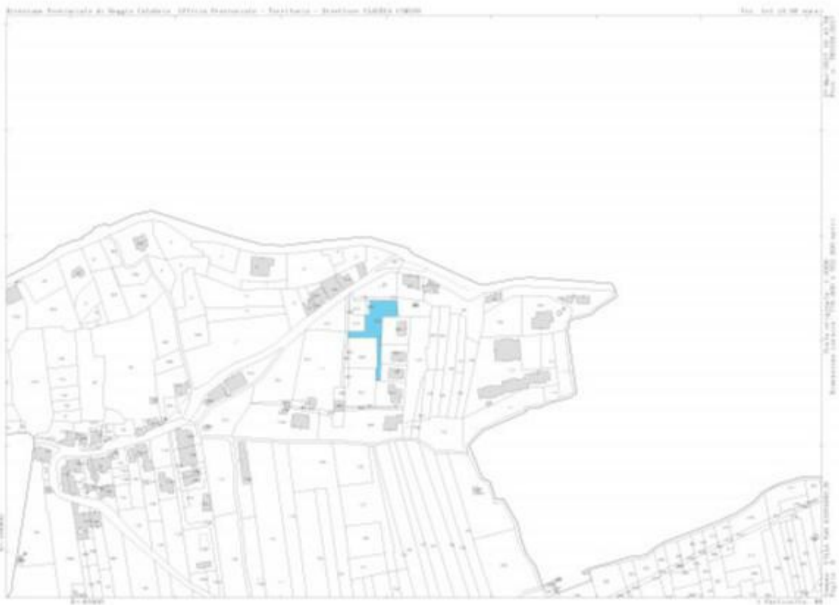
Estratto di mappa